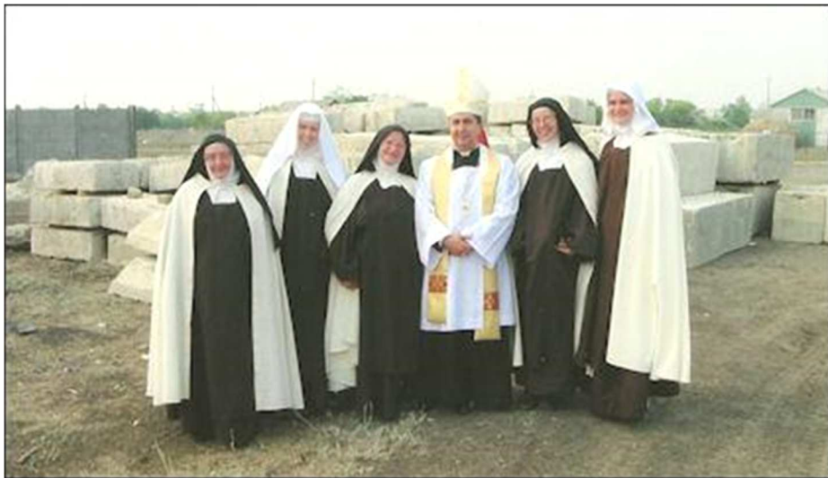
Obr: Sestry karmelitánky pri požehnaní základného kameňa kostola.