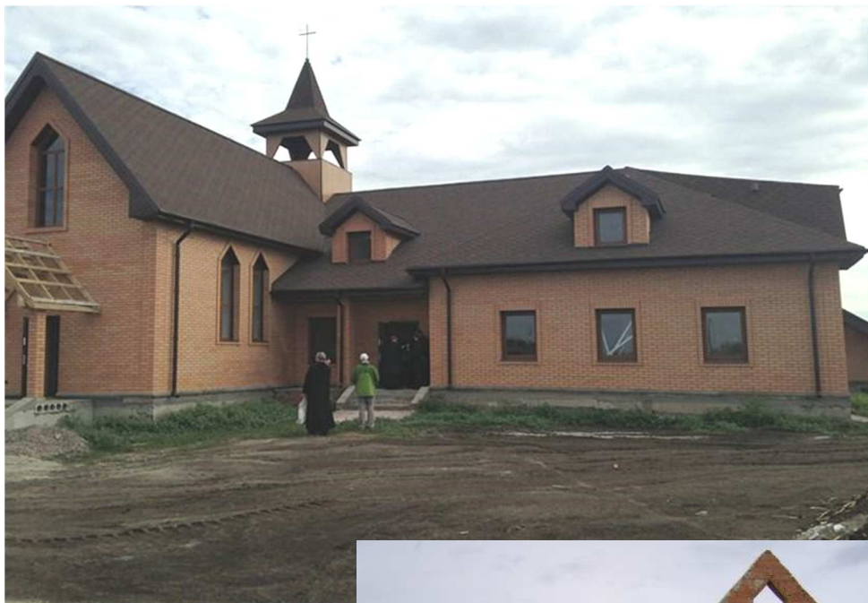
Obr.: Budova kláštora s kostolom v OZIORNOM v začiatkoch a dnes